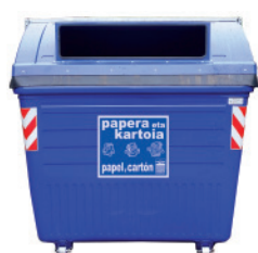
Papel y cartón

Los residuos se depositarán de forma SEPARADA, DENTRO de los contenedores: