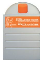
Aceite de cocina usado