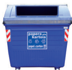
Papel y cartón

Los residuos se depositarán de forma SEPARADA, DENTRO de los contenedores: