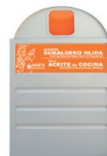
Aceite de cocina usado