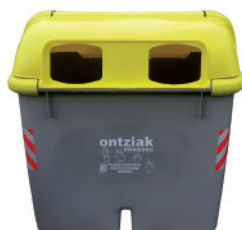
Emballages plastiques, métaux et briks