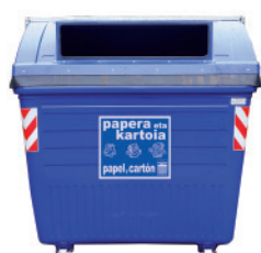
Papier et carton

Les déchets devront être déposés TRIÉS, À L'INTÉRIEUR des conteneurs: