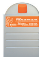
Huile de cuisine usagée