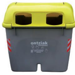
Emballages plastiques, métaux et briks