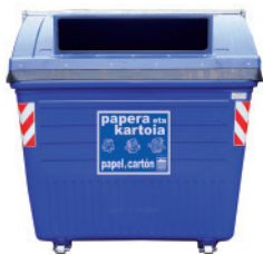
Papier et carton

Les déchets devront être déposés TRIÉS, À L'INTÉRIEUR des conteneurs :