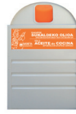
Huile de cuisine usagée