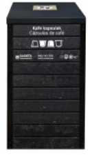
Capsules de café

Vous pouvez sortir les déchets recyclables tous les jours de la semaine, à n'importe quelle heure.